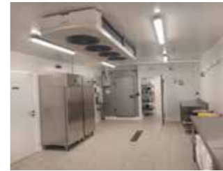
Laboratoire de pizzas complet - VIRE