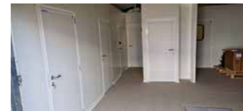
Chantier en cours de réalisation Laboratoire de pizzas complet - BRETEVILLE SUR LAIZE