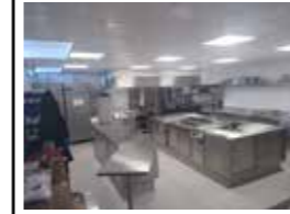
Cuisine d'un restaurant Panneaux/faux plafonds LUC SUR MER

Nous sommes en capacité de vous accompagner dans l'aménagement, la rénovation et la mise aux normes de laboratoires, de Pizzas, de boulangeries, charcuteries, restaurants.