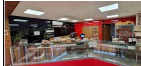
Habillage mural en Dibond brillant Rouge/Noir d'une charcuterie - SANNERVILLE